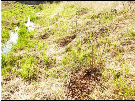
Abb. 3: Nach der Maßnahme: Anpflanzung von Bäumen und Sträuchern, 17.04.2020