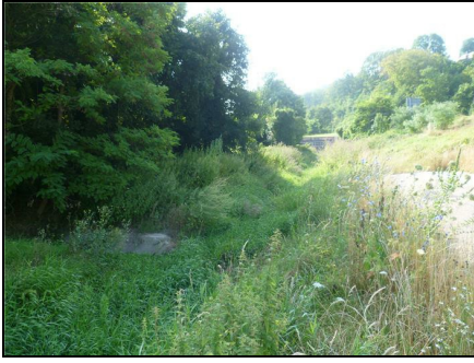
Abb. 2: Vor der Maßnahme; Fehlender Gehölzstreifen, Blick entgegen Fließrichtung, 01.08.2019