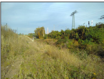
Abb. 1: Vor der Maßnahme: fehlender Gehölzstreifen, Blick in Fließrichtung, 21.10.2019