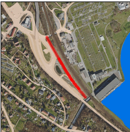
Lageplan Maßnahme, Maßstab 1:10.000